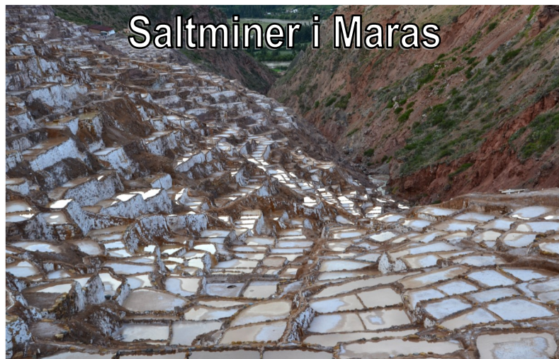
Saltminer i Maras