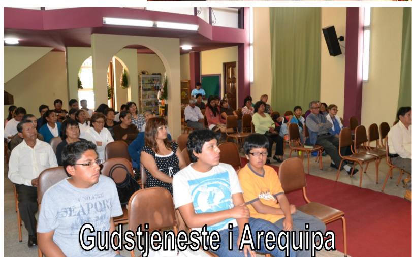
Gudstjeneste i Arequipa