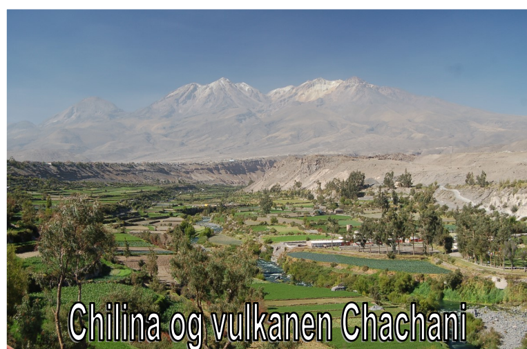
Chilina og vulkanen Chachani