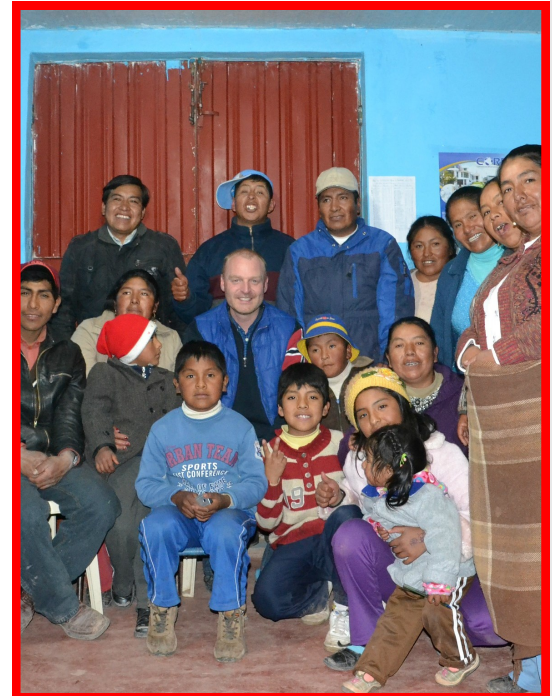
Roar til cellegruppe-møde i Juliaca.